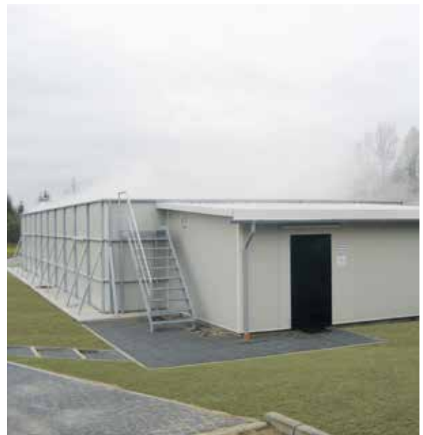
belflor® Biofilter Open