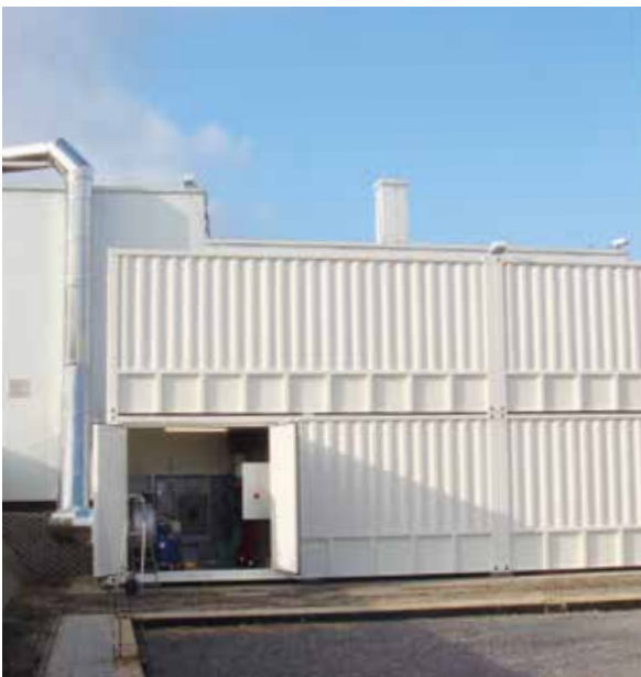
belflor® Biofilter Duo-boxed