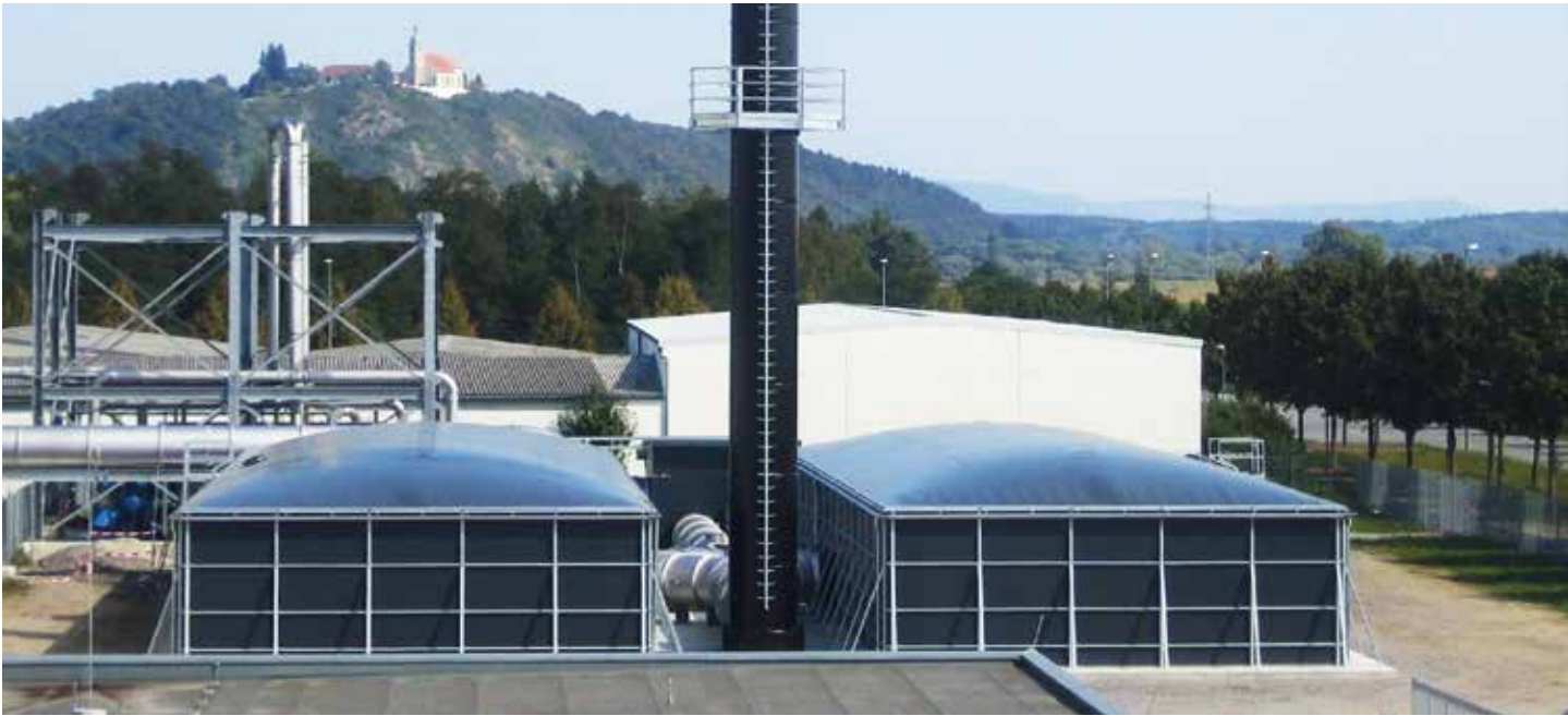
belflor® Biofilter Duo-case

wartungsarm | langlebig | niedrige Betriebskosten | CO 2 neutral | keine zusätzlichen Brennstoffe