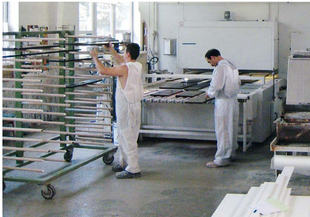
Blick in die Produktion der Möbelwerkstätten Hunke GmbH: Das Unternehmen hat sich auf die Herstellung farbig lackierter Fronten und Möbelteile spezialisiert.

Die Möbelwerkstätten Hunke GmbH aus Ostwestfalen hat sich auf die Herstellung farbig lackierter Fronten und Möbelteile spezialisiert. Neben Küchen- und Badmöbelindustrie, werden auch Wohn- und Schlafraummöbelhersteller beliefert. Ein Schwerpunkt liegt dabei auf dem Einsatz hochwertiger sogenannter High-Solid-Lacke. Das Spektrum ist groß: „Wir bie-